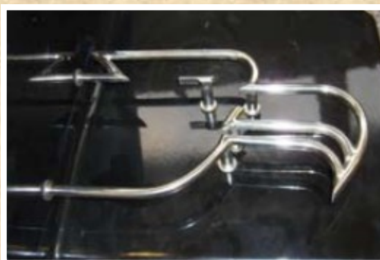
Porte bagages tête d'aigle en inox