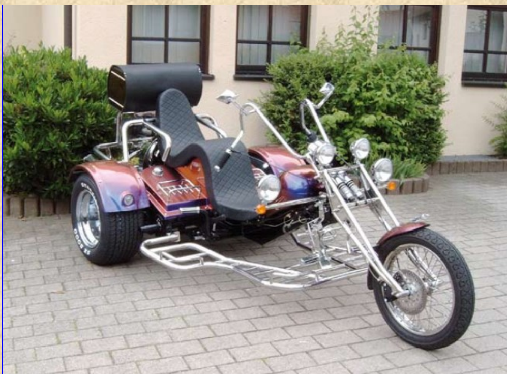
(Le modèle représenté sur la photographie comporte des options)