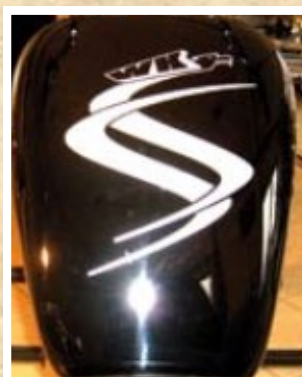
Faux réservoir en polyester